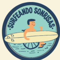
Tabla "nombre" / Donativo